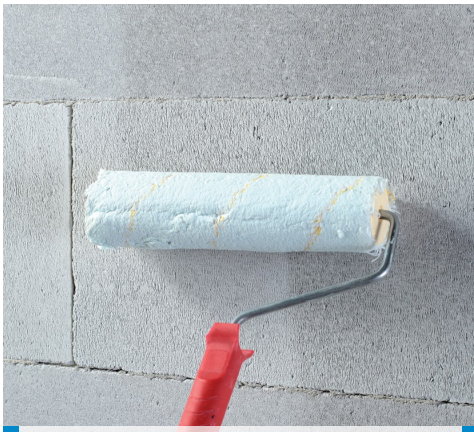
Vorstrijken van een wand