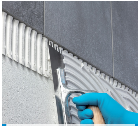
Aanbrengen van Ultramastic 5